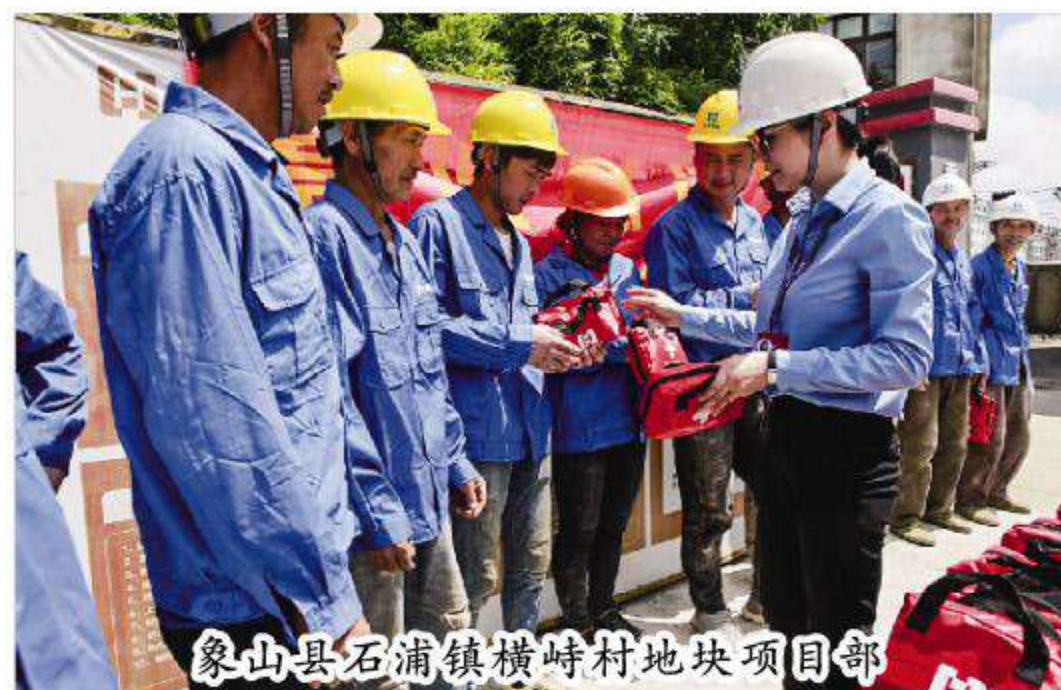
象山县石浦镇横峙村地块项目部