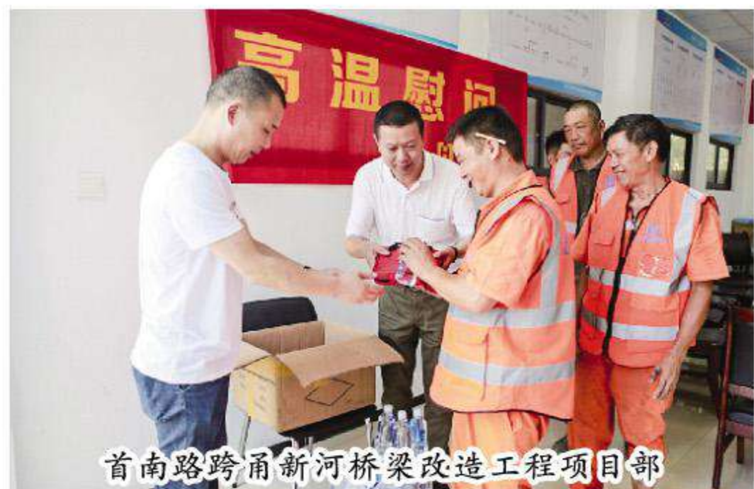
首南路跨甬新河桥梁改造工程项目部

在随后的座谈会上，双方就当前行业发展趋势及合作方向展开分析讨论。沧海紧紧抓住“美丽中国”和“长三角经济带”历史性机遇，依托创新，一跃成为宁波建筑业骨干企业，在承接项目方面，人员、经验、资质资源丰富，优势明显。恒大集团作为以民生地产为基础，文化旅游为龙头的世界500强企业集团，在中国280多个城市开发了800余个成功的地产项目。双方在城市建设领域具有广阔的合作空间，下一步将共同探索合作的途径和方式，实现取长补短、共同发展。