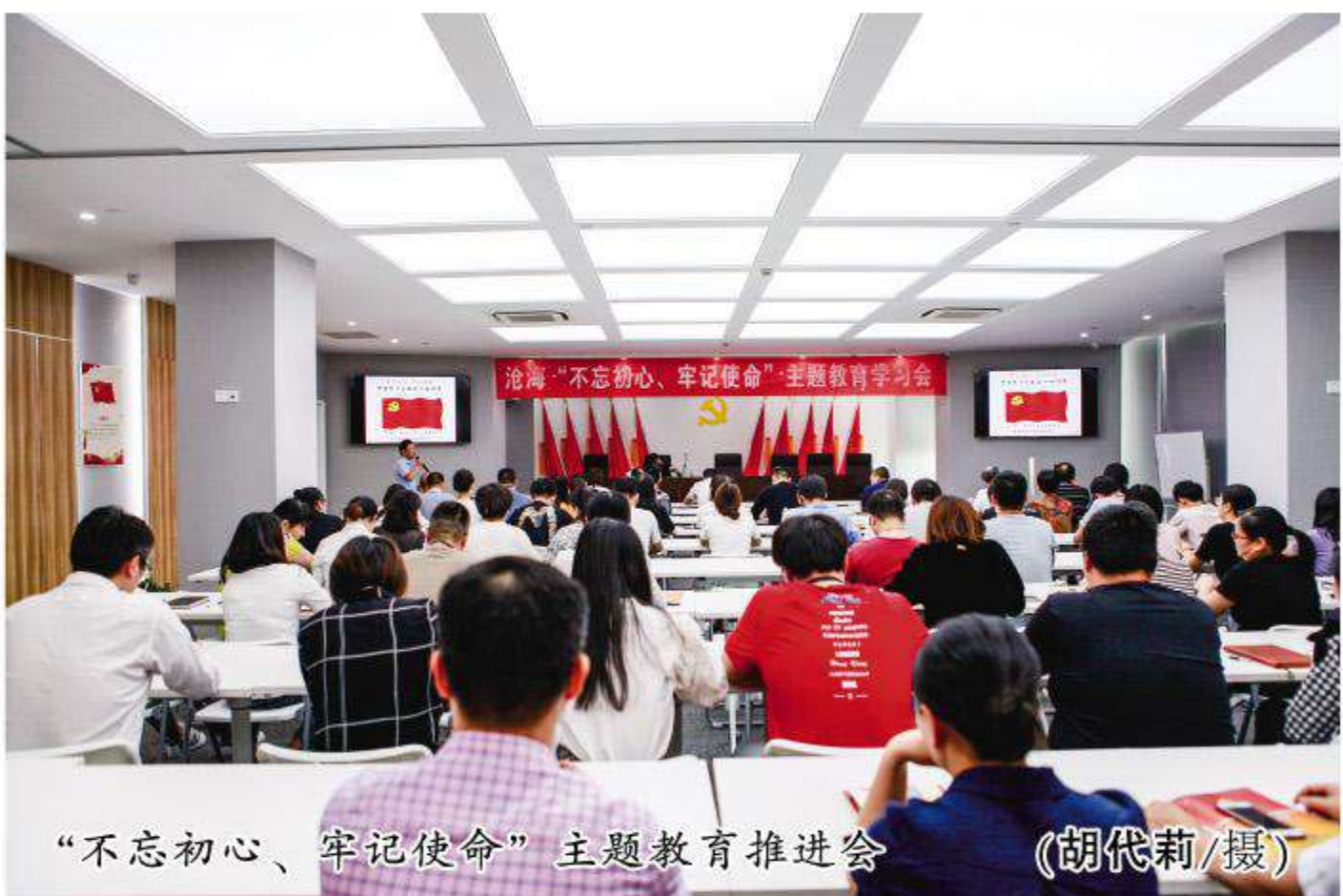
“不忘初心、牢记使命”主题教育推进会