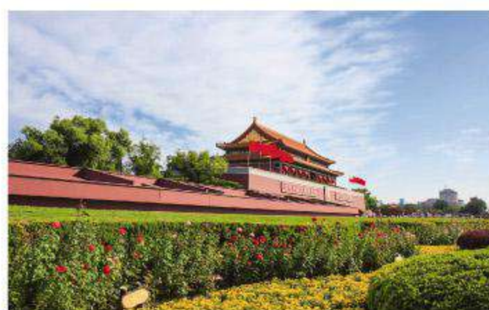
国庆那天