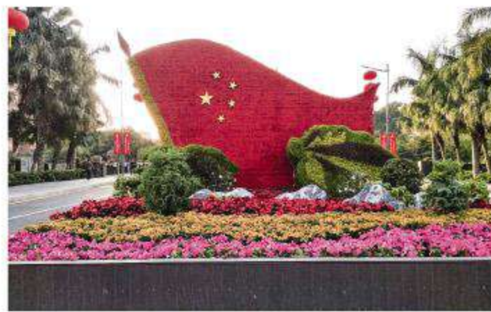
我和国旗有个约会