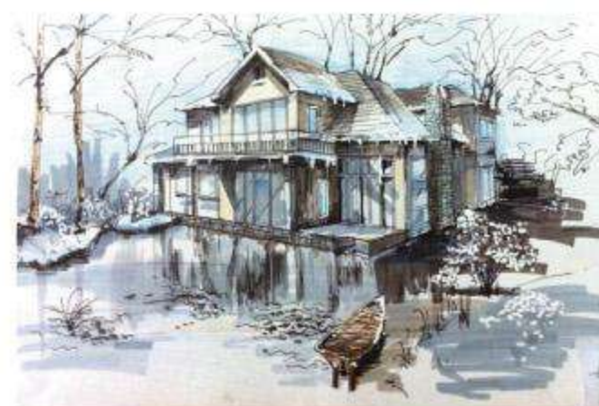
冬日里的小别墅 斯文/手绘