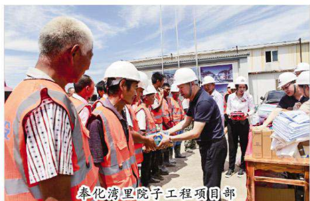
奉化湾里院子工程项目部