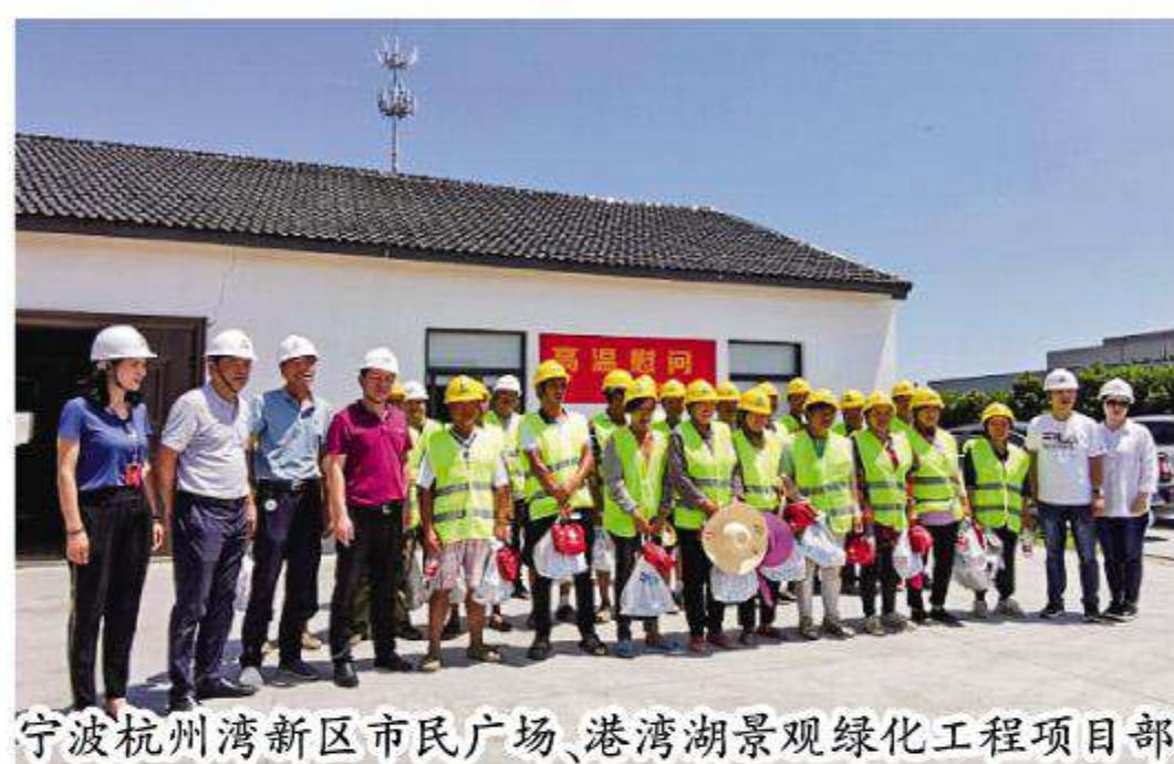
宁波杭州湾新区市民广场、港湾湖景观绿化工程项目部